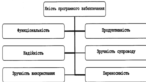
Рис. 3. Складові якості програмного забезпечення

Для ефективного ходу процесу дослідження потрібно мати програмне забезпечення високої якості, яке відповідає, зокрема, таким вимогам (рис. 3), які пов'язані з характеристиками і атрибутами якості згідно з ISO 9126:2001.