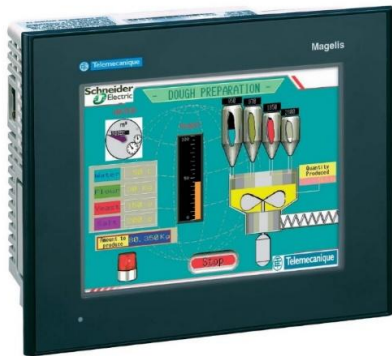
Рис. 3. Magelis XBT GT 2220

Також доцільно передбачити масштабування підсистеми візуалізації під мобільний додаток на планшет або смартфон [5].